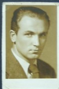
STUDENT POLITECHNIKI LWOWSKIEJ