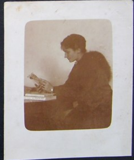
MAMA, A GDZIE WOJTEK? 1916