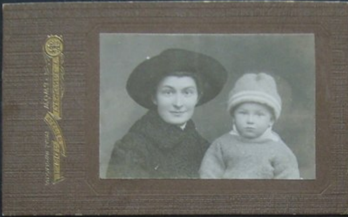
MAMA ZE STACHEM