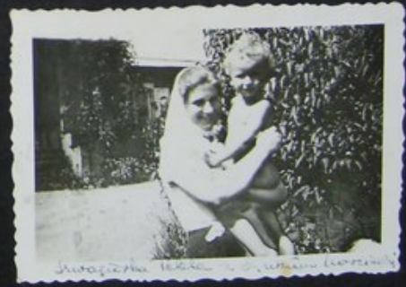
TEKLUNIA z OLKIEM