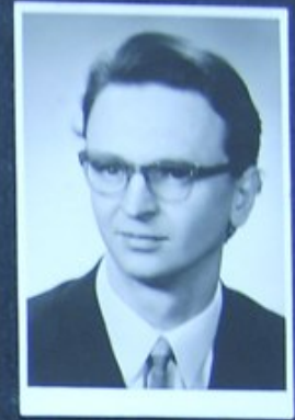
OLEK JUŻ LEK.WET.