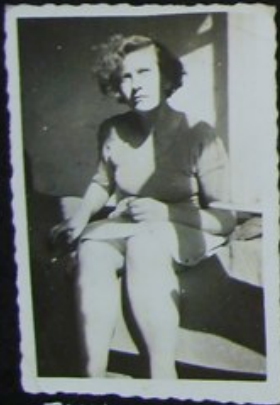
TLUNCIA GDANSK 1953