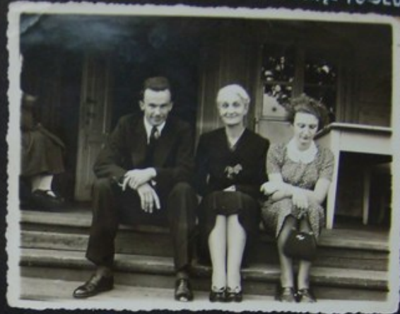
JA, MAMA, MANIUSIA