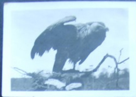
SĘP PŁOWY ZASTRZELONY W CHOROBRÓWIE W 1941r. PRZEZ DZIADKA WINCENTEGO KRUSZEWSKIEGO