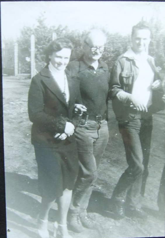
TATA Z DZIEĆMI