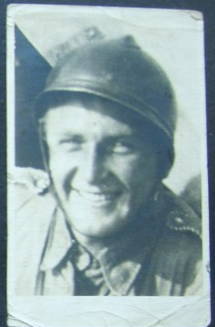
PODCHORAŻY REZ. 9 PUŁKU STRZELCÓW PODHALAŃSKICH W SANOKU. ZGINĄŁ 8. IX. 1939 POD KIELCAMI