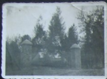
BRAMA WJAZDOWA W GĘBIE DWÓR