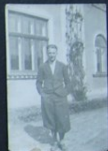
STACH DĄBRÓWKA POLSKA DWÓR K. SANOKA 1932