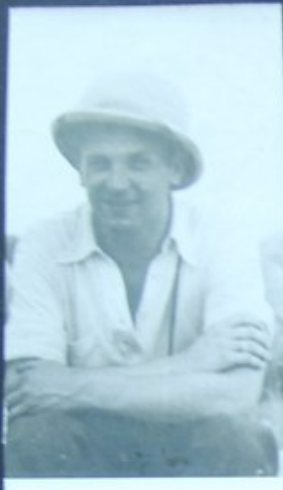
SENEGAL DAKAR 1935