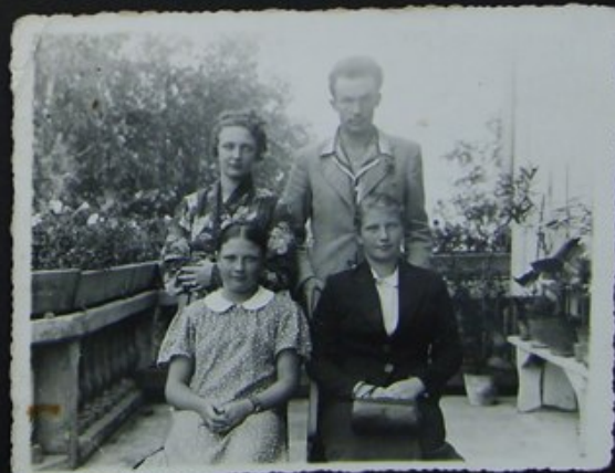
MANIUSIA, JA ANULKA, TEKUNIA