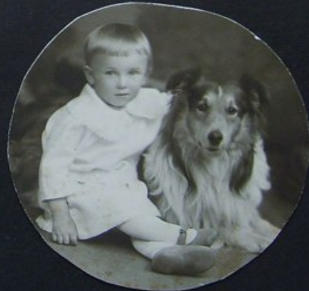
Stach z „Ajaksem”

Duchujemy se przeszke sa lat: - karku se objaw. se u nas se prazloveniu. - vana spolna fotografie slobie - tylo Trj i Mrcia parket si nie udeci - svice svatti steta i se oicuna leer poz byly nie i adue, nie nie nie slobodi. fenei ree unas het . odebrke: —