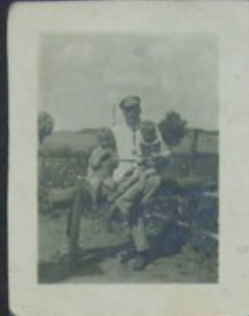
DZIADUNIO z OLKIEM I LALĄ