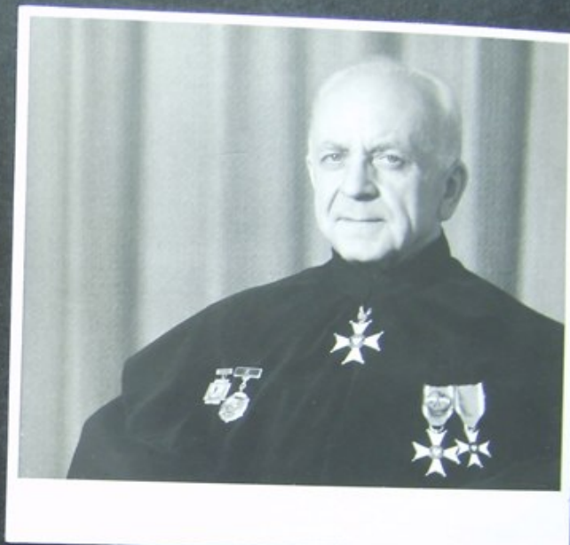
FELO W TODZE PROF. W.S.R. W POZNANIU