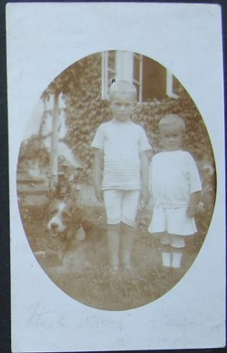
WICEK I WOJTEK